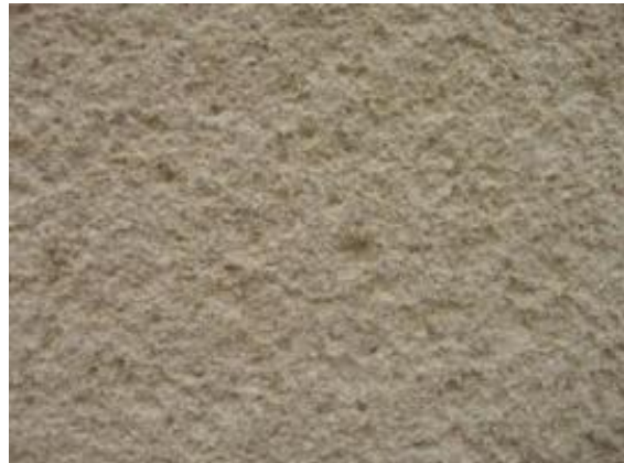
obr. 3 - škrábaná struktura

Po nástupu moderních technologií v 21. století se ve velké míře ustoupilo od používání břízolitu na fasádách a omítka byla nahrazena tenkovrstvými šlechtěnými probarvovanými omítkami. V posledních letech se však zájem o břízolit obnovuje, zejména pro jeho mechanické vlastnosti, vysokou pevnost a odolnost proti klimatickým vlivům, ale také proto, že jeho struktura se jeví jako zajímavá pro povrchovou úpravu fasád moderních staveb, kdy bývá architektky využíván jako finální vrstva fasád nových objektů.