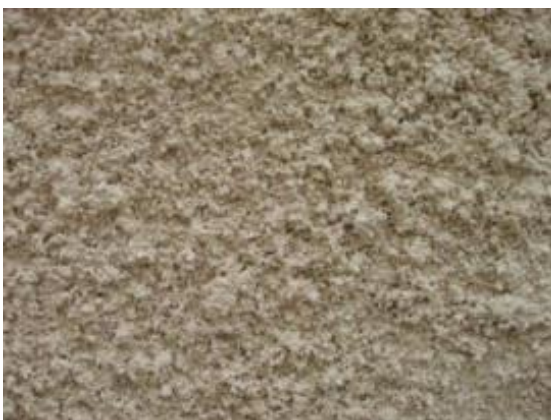
obr. 2 – stříkaná struktura

Pro břízolit jsou typické dvě základní struktury. Struktura stříkaná (obr. 2) se vyznačuje množstvím výstupků a nerovností vystupujících z plochy omítky. Struktura škrábaná (obr. 3) je charakteristická prohlubněmi vzniklými po vyškrábaných kamíncích. Zejména struktura škrábaná může být doplněna přidavkem drčené slídy, která dá břízolitu typický třpytivý efekt. Barevné provedení břízolitů bylo jednoduché a zahrnovalo většinou škálu šedých odstínů doplněnou o odstíny bílé, žluté, okrové a v ojedinělých případech také s nádechem do červena, hněda či zelena.