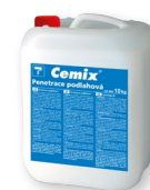
Cemix Penetrace podlahová