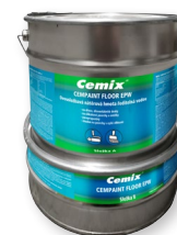
Cemix CEMPAINT FLOOR EPW Nátěr ve třech vrstvách