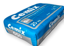
Cemix 050 Samonivelační stěrka NIVELA PLUS v tl. 2-10 mm, po 24 hod. přetíratelná